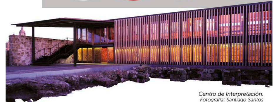
Centro de Interpretación.