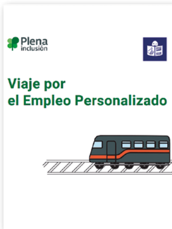
Viaje por el Empleo Personalizado