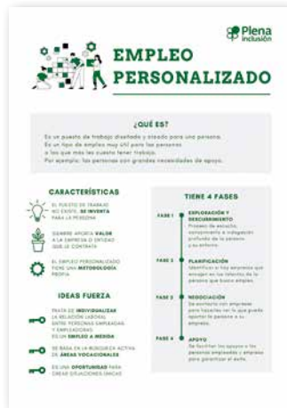
Empleo personalizado. Qué es, roles y fases