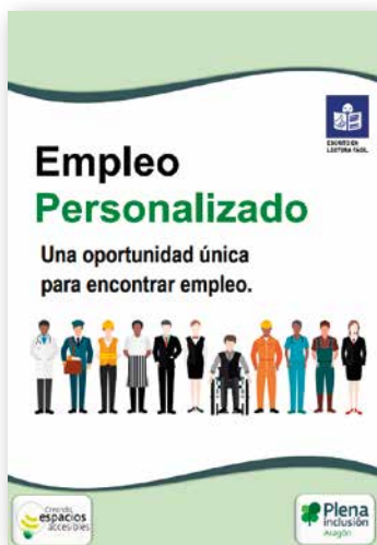
Empleo personalizado. Una oportunidad única para encontrar empleo. Lectura fácil