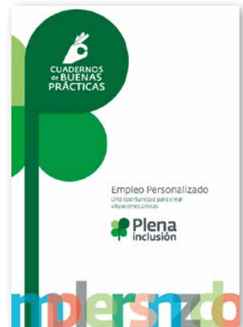
Empleo Personalizado. Una oportunidad para crear situaciones únicas