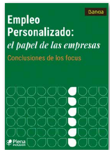
Empleo Personalizado. El papel de las empresas, conclusiones de los focus