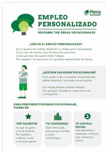
Empleo personalizado. Áreas vocacionales