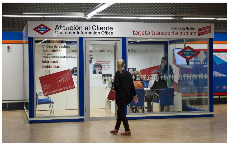
Foto de una Oficina de Gestión de la Tarjeta de Transporte Público de la Comunidad de Madrid