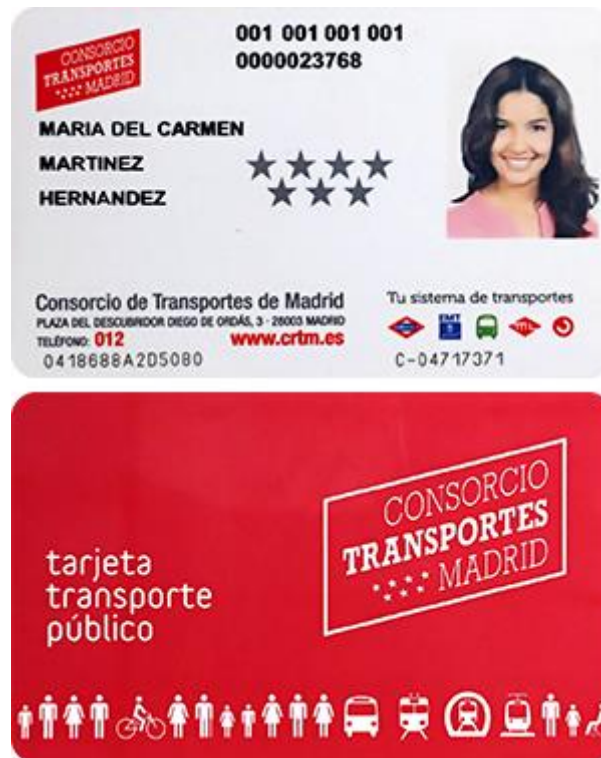
Foto del abono de transporte de la Comunidad de Madrid