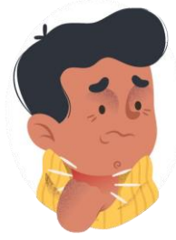
Dolor de garganta y de pecho