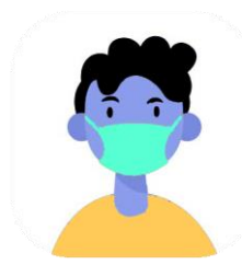
Evitar el contacto con personas enfermas. Utilizar mascarilla si estoy enfermo