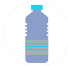
Por tocar objetos contaminados por el coronavirus