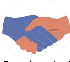
Por el contacto con personas enfermas. Por ejemplo, al tocarse o besarse