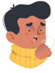
Tos seca y dificultades para respirar