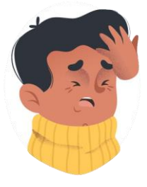
Dolor de cabeza y cansancio