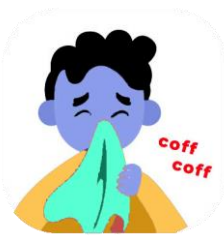
Toser y estornudar cubriéndome la boca con un pañuelo desechable