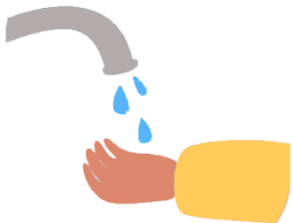
Lavarme las manos con frecuencia