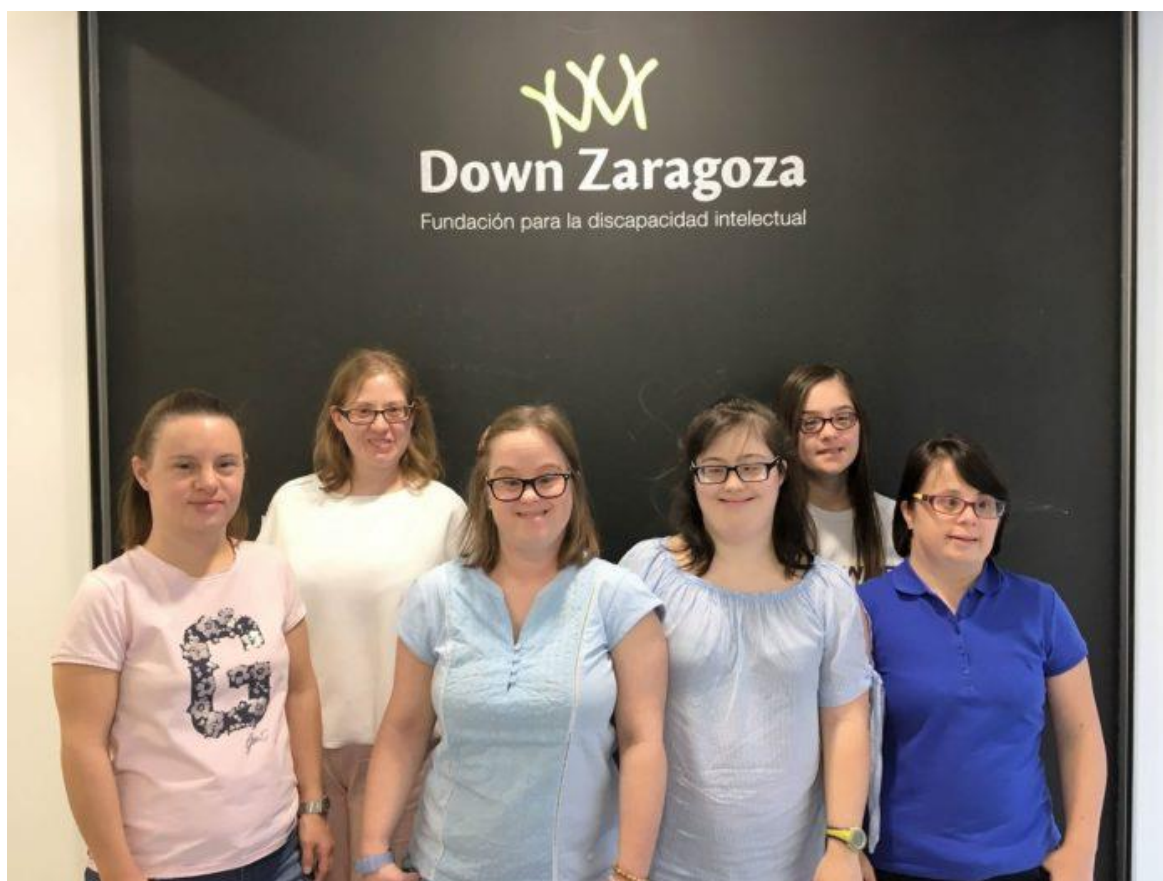
Foto de personas de Down Zaragoza.

que les orienten y ayuden a cuidar sus derechos.