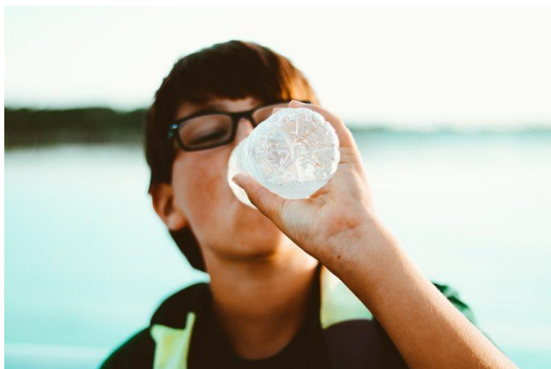
Foto de una persona bebiendo agua

Más información: Consejos ante una ola de calor