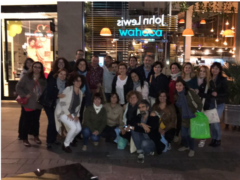
Foto del grupo que hizo el viaje