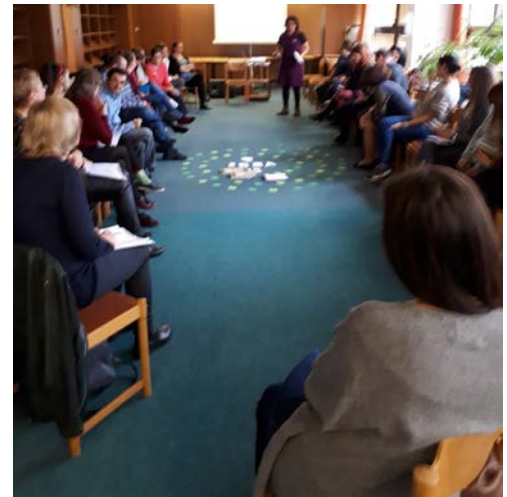
Foto: Reunión en Praga.